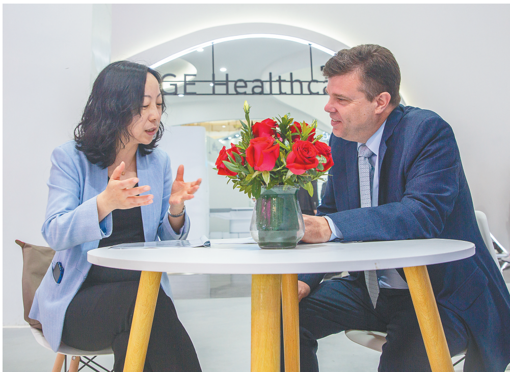
在博鳌乐城先行区国际创新药械转换中心,嘉宾在交流洽谈业务。

“这个共同体相当于一个‘朋友圈’。”顾刚表示,乐城的政策很独特,但乐城的改革探索要惠及全国,有了“朋友圈”会让其他园区了解乐城更加方便,同时也能够利用不同的定位实现优势互补、互利共赢,推动产业上下游更多地合作,积极推进健康与养老、旅游、互联网、食品等产业融合发展,探索健康产业新模式,共同实现高质量发展。(本报博鳌4月25日电)