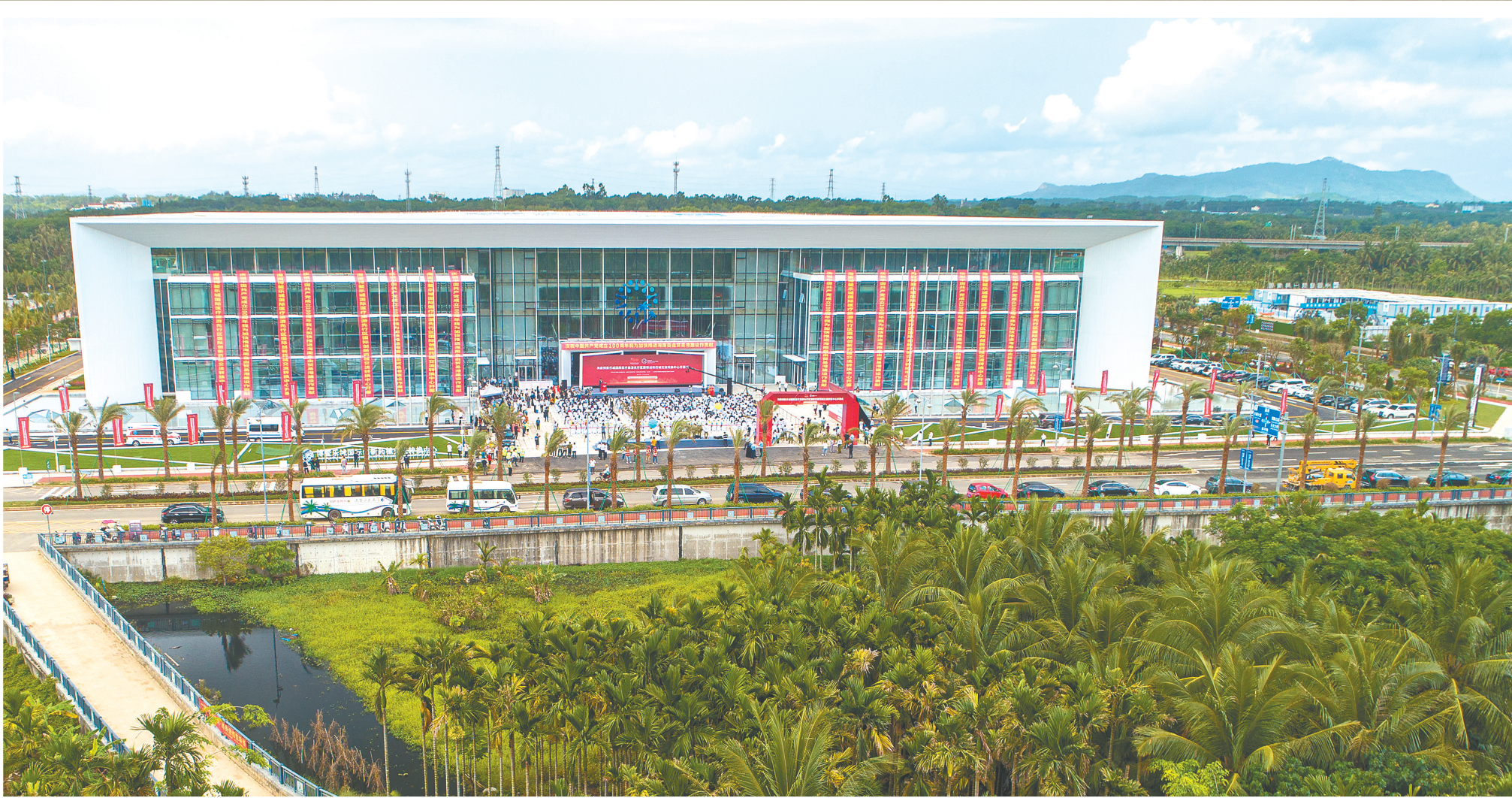
博鳌乐城国际医疗旅游先行区国际创新药械转换中心。