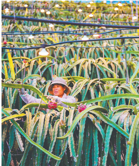
东方水果岛火龙果基地内，果农在观察植株生长情况。

业作为主攻方向和重点产业，推动产业链创新链“双链”融合、产学研协同创新；注重提高园区企业和产品的相互依存度，围绕现有企业和产品，积极向下游延伸产业链、提升价值链，打造产业集群；积极推动板桥科创园等平台建设，上彩花卉、中正水产和华盛新材料入选2021年度海南省重大科技项目。