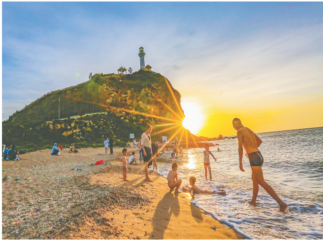
东方市鱼鳞洲风景区落日美景。

产业的发展，人是最重要的因素。东方还统筹城乡一体化发展，加快“村改居”，推进农业转移人口市民化，增强中心城市经济和人口承载力。同时通过建设一批重大产业项目，创造大量就业岗位和创新创业机会。着力招才引智，最大限度留住本地人才，吸引更多外来人才，把东方打造成为海南西南地区人口流入高地。