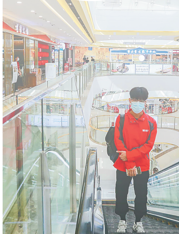
东方万达广场内景。