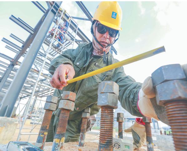
丙烯腈项目工地上，工人在施工。

东方“十四五”规划明确，未来，利用海南自贸港“零关税”、离岛免税等政策，参照香港机场货运模式，依托临空经济区，创新发展航空保税仓储物流、国际国内配送、货物集拆混拼、进口商品展销、国际国内中转、跨境电商等航空物流业务，不断提高航空物流增值率。同时着力发展东南亚、南亚、大洋洲、非洲与日本、韩国等地区和国际货运中转，大力发展境外与内地的国内外货物中转业务，加快融入国际航空物流供应链网络，构建连接印度洋、太平洋的航空物流通道，到2035年，基本建成面向两洋的区域性国际空运物流枢纽。