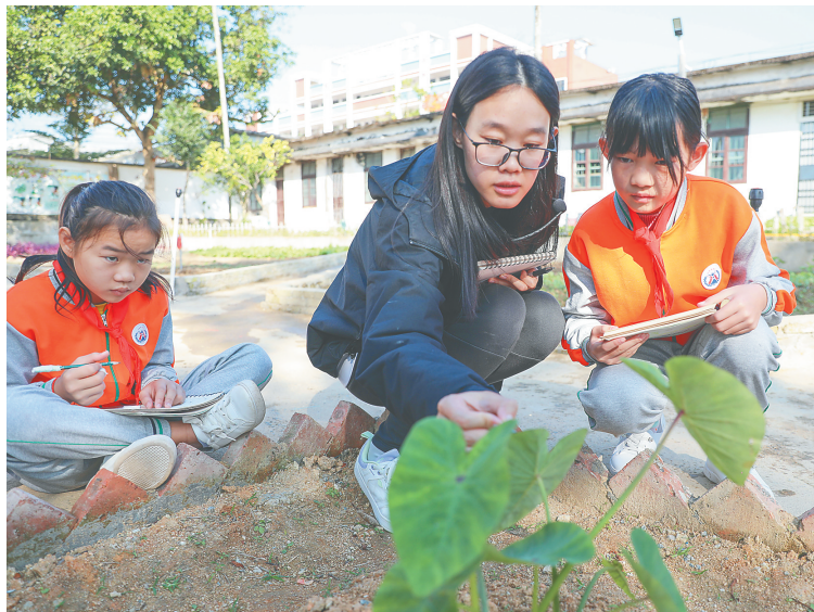
在屯昌县屯城镇大同小学田园课程基地,老师指导学生观察芋头叶片的纹理。