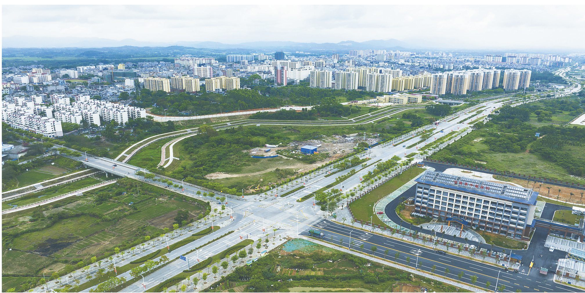
屯昌县屯城镇路网建设日趋完善。