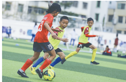
琼中男女足球队员一起挥洒汗水刻苦训练。

“长期以来,体育教育在学校教育中一直处于‘弱势地位’,这一倾向带来的青少年体质下降等问题近年来也引发诸多关注。”琼中教育局局长敖林认为,在琼中女足这块“金字招牌”的光环笼罩下,足球无疑成为该县提升体育教育质量的最佳抓手。