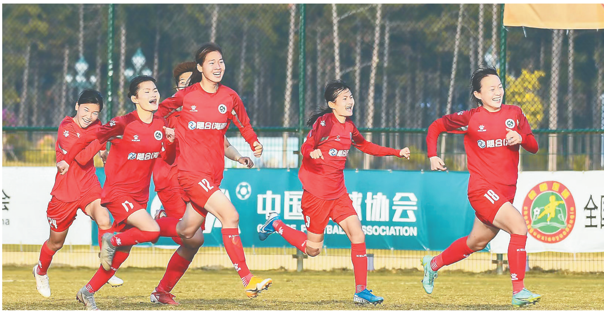
琼中女足获胜后狂奔庆祝。