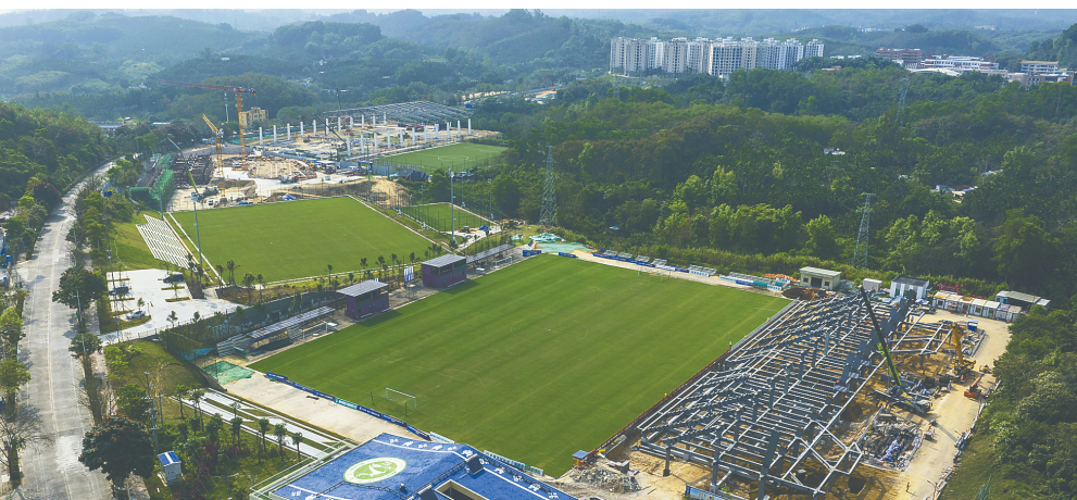
俯瞰琼中体教融合产业发展(琼中女足)示范区项目。