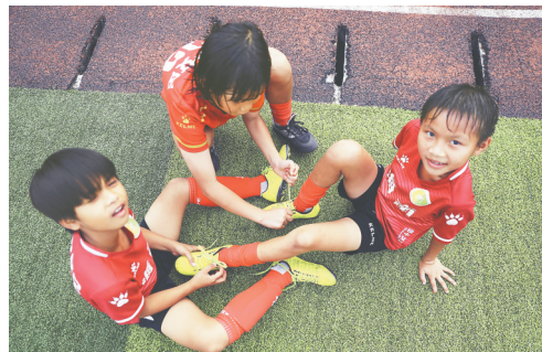
琼中女足一名队员鞋带松了,队友帮她系鞋带。

在肖山看来,国民教育体系培养各个行业的专门人才,体育人才正是其中之一,而体育与教育在功能与目标上的充分融合,正是探索体教融合的题中之义。