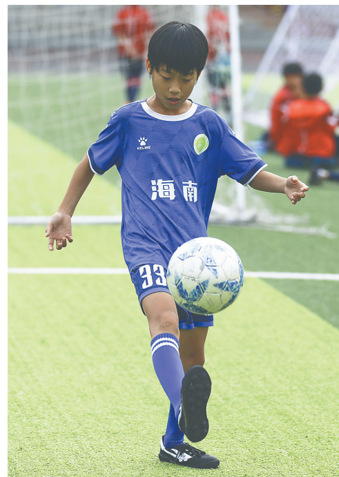
在华中师范大学琼中附属中学思源实验学校,琼中女足队员训练颠球。