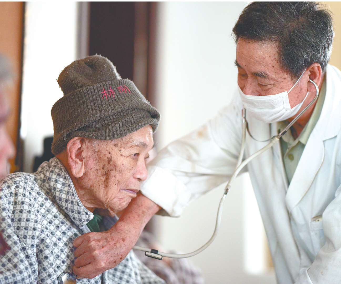
在海口一家老年护理院内，工作人员细心照顾老人。(资料图)

将这样一个具体、细微的目标列入党代会报告，又将其写入重点任务，引来不少党代会代表和干部群众的关注。大家表示，这不仅体现出在海南自由贸易港建设热潮下，省委坚持以人民为中心，让自贸港建设红利更好更快更多惠及百姓的决心与作为，也进一步突出海南“健康岛”定位，彰显海南在健康事业与产业发展中的活力与潜力。