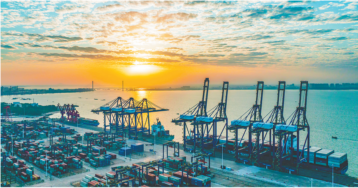
洋浦经济开发区国际集装箱码头。

省第八次党代会代表、海南热带雨林国家公园管理局毛瑞分局副场长黄海警: 倾心保护好 海南热带雨林这个“国宝”