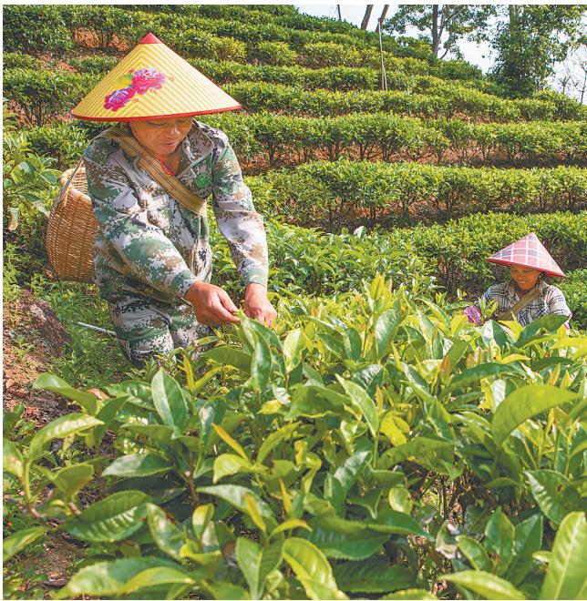
在五指山市水满乡毛纳村,村民忙着采茶。

其中,有7名代表来自习近平总书记考察过的地方,对报告感受颇深、思考颇多,纷纷表示将贯彻落实习近平总书记考察海南重要讲话精神,以及省第八次党代会精神,团结带领身边党员干部群众,全面落实“一本三基四梁八柱”战略框架,为加快建设具有世界影响力的中国特色自由贸易港,让海南成为新时代中国改革开放的示范,把海南自由贸易港打造成展示中国风范的靓丽名片作出应有的贡献。