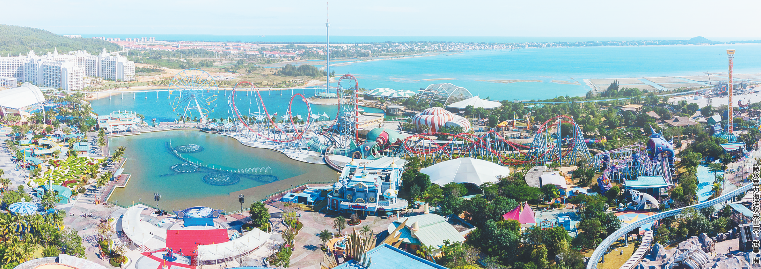
陵水富力海洋欢乐世界。