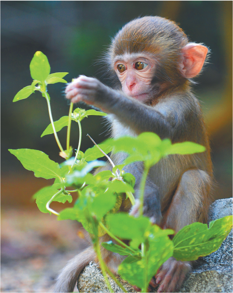
南湾猴岛上的小猕猴。