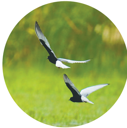
海尾国家湿地公园(试点)中的白翅浮鸥。

“为了维持生态平衡，给鸟类更好的栖息环境，接下来我们将开展针对外来物种水葫芦的清理工作。同时通过安装红外线记录仪，弥补人工无法监测的空白区域。”薛美丽说。