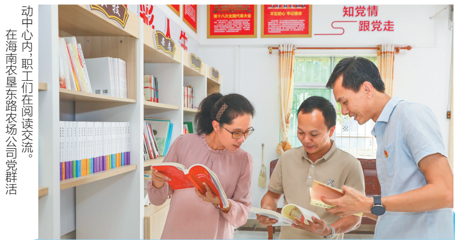
动中心内，职工们在阅读交流。 在海南农垦东路农场公司党群活