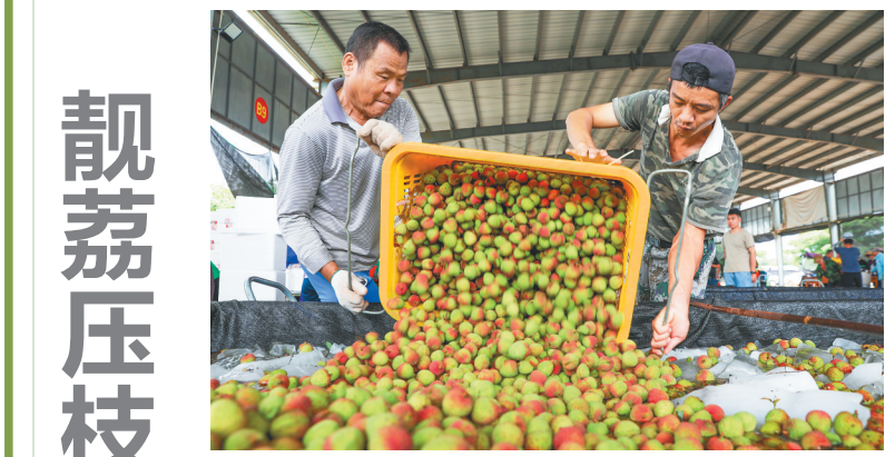
5月5日，在文昌市东路镇的水果集散中心，工人在忙碌整理刚采收的新鲜荔枝。