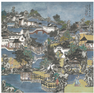
《金陵十二钗》(纸本彩墨)

可喜的是,他们在奋进的过程中不断冲破思维的枷锁,从中西文化中找到合理的元素进行多方位的整合,从继承与创新的尺度之间找到了新切入点。因而,这个由“人·社会·自然”为源头的“自然印象”在他们的淬炼之下转变为具有社会价值、审美特质与精神秩序的“艺术印象”。这一切既源于他们对这片大地的深情与热爱,以及年轻人鲜活的生命力,其在不断自我超越的过程中,蜕变为“时代精神”的“新象”。