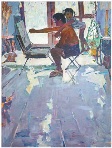
《怡情·家园》(布面油画)