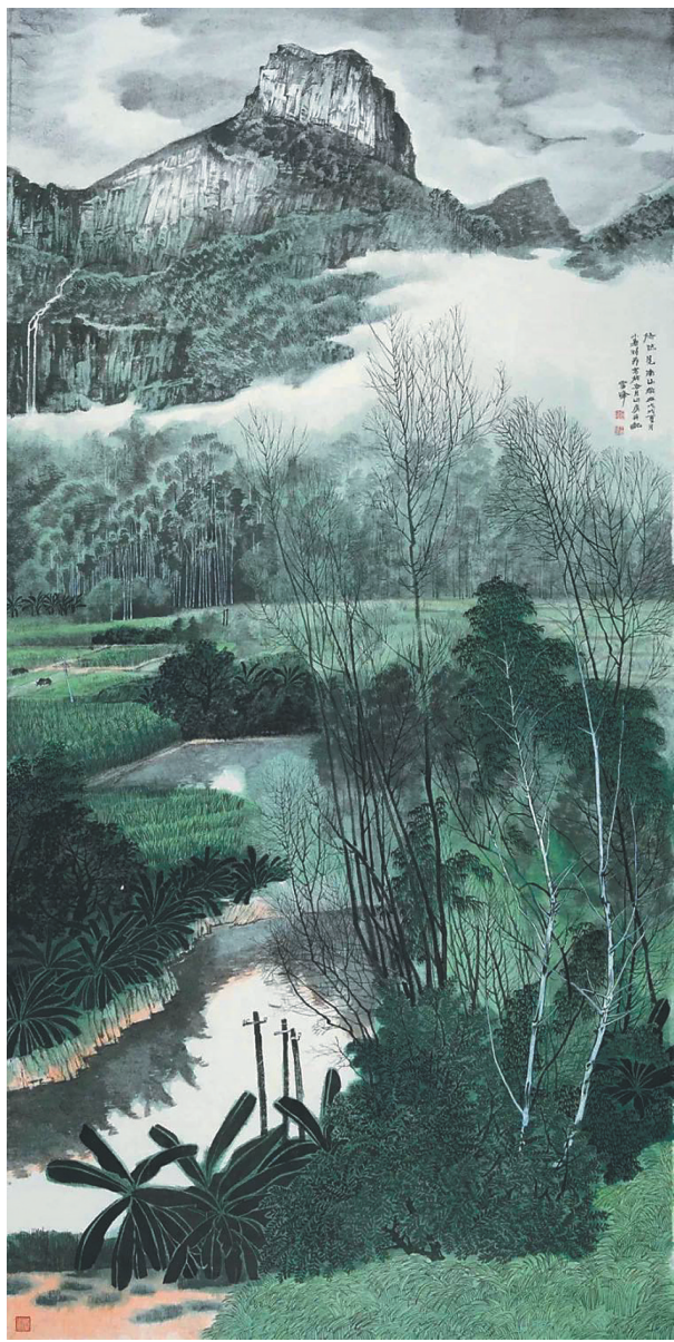
《悠然见南山》(纸本设色) 王雪峰