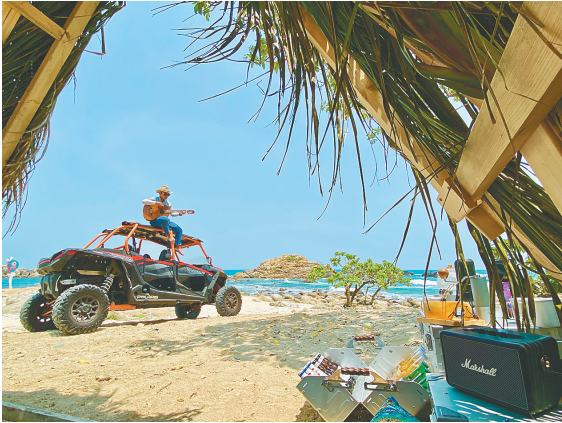
游客在蜈支洲岛旅游区体验户外露营。

彩虹卡丁车等新游玩项目,还打造了天涯书局、天涯文创院、鹿回头山顶鹿见咖啡等“小而美”的精品体验场所,为游客提供优质旅游功能的同时,也为本地居民提供一个良好的休闲空间,让景区成为主客共享的美好生活空间。 三亚还将特色旅游体验带到省外,今年4月,在成都麓湖水城景区,该市启动2022年“焕新三亚·升级美好”旅游推介活动,现场以精致露营为主题,引入咖啡快闪店、草坪飞盘、清补凉DIY、草坪音乐会、迷你高尔夫、露天观影等热门潮流活动,全方位满足游客的餐饮、游乐和打卡需求,让成都游客足不出市,体验“三亚的一天”。