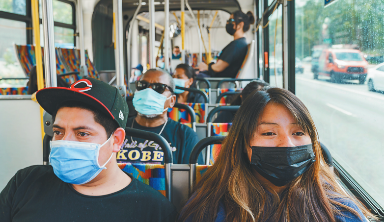
美疾控中心估算，至少58%美国人已感染过新冠。图为乘客佩戴口罩在美国洛杉矶乘坐车辆。

民调显示，不到三分之一的调查对象表示“有点”或“非常”担心染疫。多数人认为疫情正在好转，21%认为“情况不变”，12%认为疫情变得更糟。另外，不少人放松警惕，不再