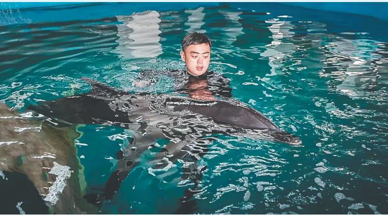
工作人员下水伴游，帮助受伤海豚恢复游动能力。

当前，海豚血液指标显示海豚肝脏转氨酶偏高，仍存在慢性炎症，接下来将持续进行药物治疗，并保持每10天左右进行一次血检。此外，在外伤基本痊愈的情况下，海豚将于近期从较小的医疗池转入至水体更大的生活水池，以扩大海豚的活动范围，增加活动量，保证海豚的健康恢复。