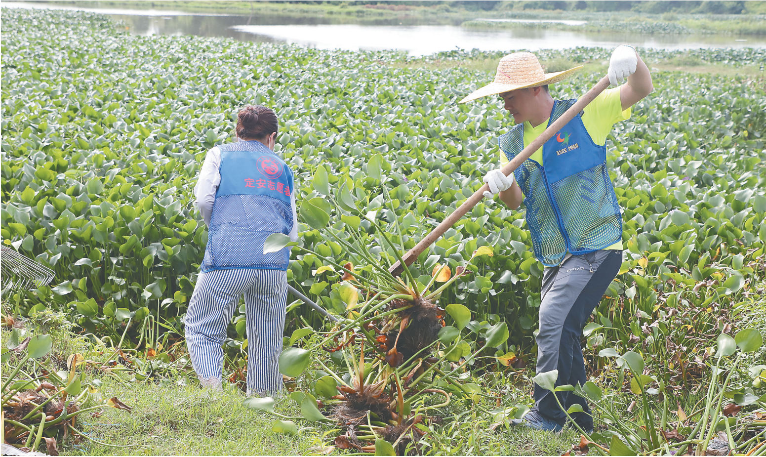
5月13日，定安多部门在定城镇南蛇沟联合开展水浮莲清理行动，对河道内的水浮莲、生活垃圾等进行清理。