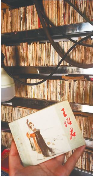
林书国四十年间收藏的连环画摆满了一个书架，堪称藏馆一小景。