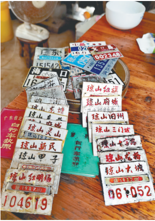
林书国收藏的自行车牌照。

初次见面，林书国穿着一身劳保工服，因焊接而留下的污渍依稀可见。他身材精瘦，头发乌黑，说起话来思维清晰、中气十足，完全看不出他已有50岁。他曾在家乡海口市琼山区三门坡镇桃村种过地，在老城区博爱南路做过三轮车搬运工，后来在三门坡镇上开了家电焊店。林书国在乡间还有一个特殊的身份——“农民收藏家”。