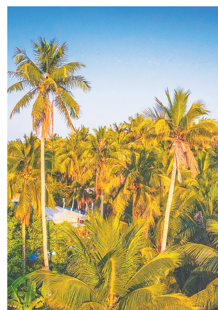
文昌着力扩大椰子种植面积。

据介绍,为加快健康环境建设,完善健康政策保障,提高人群健康素养,文昌市充分发挥文昌市广播电视台《健康在线》栏目、微信公众号《健康文昌》等平台作用,广泛开展健康知识宣传。此外,文昌市还通过专题讲座、现场咨询等形式大力开展健康宣教主题活动,让健康教育进乡村、进机关、进企业、进学校、进社区,全面倡导健康生活方式,形成政府主导、部门协作、社区行动、全民参与的良好氛围,居民健康素养水平也由2018年的12.5%提升至2020年的24.4%。