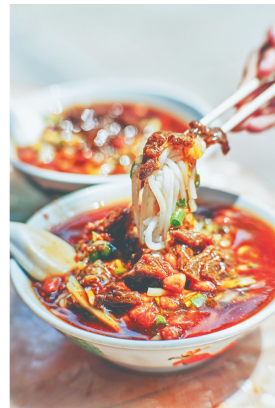
文昌抱罗粉。

目前,抱罗镇上的抱罗粉品牌旗舰店正在加紧建设,其将作为文昌市官方展示平台,对外集中展示“一碗粉”的制作工艺、文化内涵等。“等到抱罗粉真正实现标准化生产后,我们的目标不仅在岛内,还将放眼岛外,让文昌的又一特色产品,能够在更广阔的市场中分一杯羹。”唐甸远说。(本报文城5月18日电)