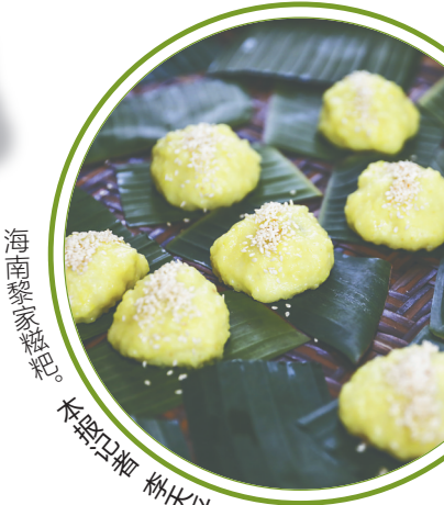
海南黎家糍粑。