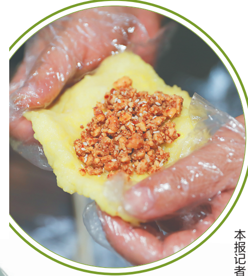
五指山市水满乡毛纳村的糍粑制作。

海南民风淳朴,常年“人情面子”不断,而这些“人情面子”往往也与各种粮食有关。有为孩子满月做的“过月粑”,为满周岁孩子庆生的“对岁粑”,有出嫁女儿给娘家父母庆生做的“生日围粑”,有新娘出嫁后回娘家的“迎路粑”,有为亲人洗尘的“米困”……海南粮食伴民俗而生,也随民俗流传至今,甚至被不少在马来西亚、新加坡等地的海南华侨们带出国门,成了海南人民与故乡之间的情感纽带。