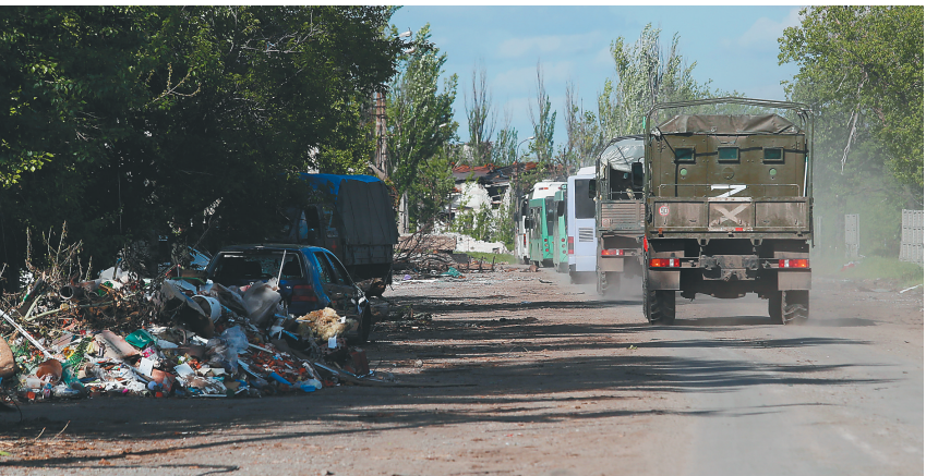
5月20日，载着乌克兰武装人员的巴士驶离马里乌波尔。

欧盟委员会方面建议，欧盟年底前将对俄罗斯天然气的需求减少三分之二，在2027年前逐步摆脱对俄罗斯化石燃料的依赖。然而欧盟内部对此一直存在分歧，对俄能源依赖程度较高的国家态度十分审慎。多国表示不能“匆忙行事”，能源开关不可能“一夜之间关上”。 欧委会执行副主席弗兰斯·蒂默曼斯警告说，与俄罗斯能源“脱钩”可能带来比乌克兰危机“更大的伤害”。