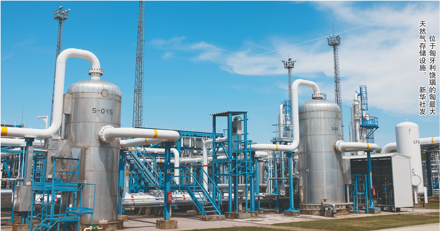
天然气存储设施。位于匈牙利饶瑞的匈最大天然气存储设施。

俄乌冲突升级已近三个月，欧洲社会在能源危机中越陷越深，欧洲企业和民众人心惶惶。一边是至少短期难以摆脱的对俄能源依赖，一边是对俄制裁引起的反噬，欧盟处境愈发窘迫，其应对措施也无异于扬汤止沸，却让美国政府及能源企业坐收渔翁之利。