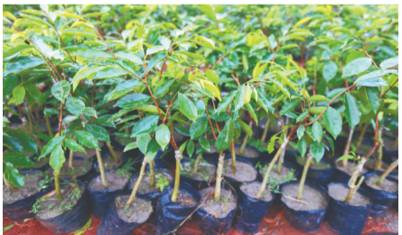
定安县龙河镇奉持香山奇楠产业三号示范基地的沉香苗。

专家介绍,我省野生沉香资源主要分布于霸王岭、吊罗山、尖峰岭等区域,十分稀少。目前,我省屯昌、定安、东方、保亭、陵水、琼中、临高、白沙等市县均有农户种植沉香树。但由于沉香结香慢、产出率低,再加上近些年沉香受到市场追捧,香的开采量大幅增加,野生资源越来越少,要在海南找到好香也并不容易。