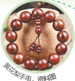
黄花梨手串。资料图