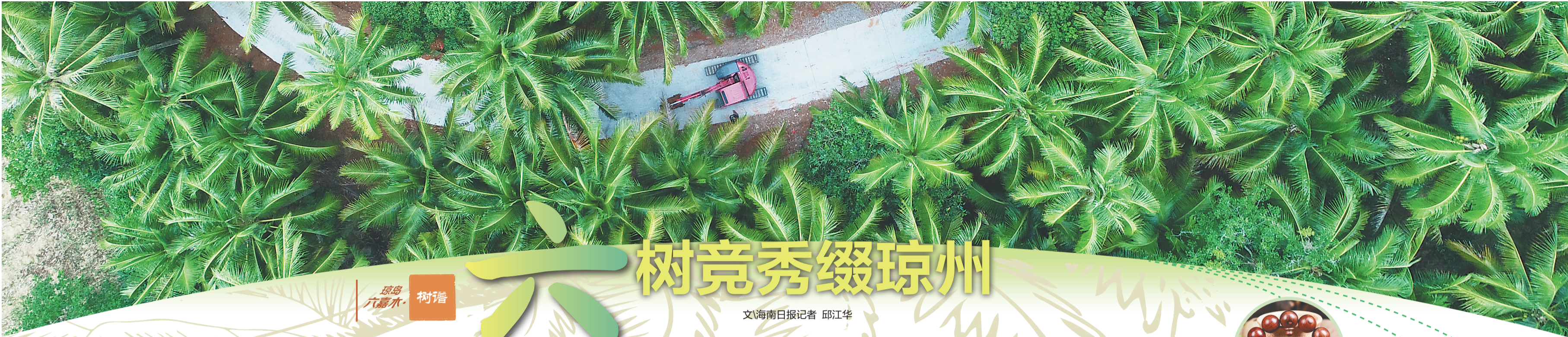
文昌市重兴镇排田村的椰林景观。