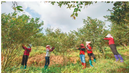
琼海市万泉镇的一处油茶种植基地,工人在采摘油茶果。

我国古人对山茶的称呼有“木贾”“员木”“探子”等。不知是谁为海南山茶取了“山柚”之名,用“柚”这个字大概是从山茶果的形狀着眼产生的联想。☞