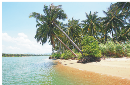
三亚海棠湾一带的椰子树。

夏季南海西部盛行西南季风,洋流的流向也是自西南向东北。因此,从南海南部过来的洋流,可以将马来群岛和中南半岛沿海的椰子一路运送到海南岛东部海岸登陆。位于海南岛东北部的文昌,就如伸出的一只手,挡住了海南岛沿岸的夏季洋流,文昌南部的东郊成为椰子登陆生长的最好地点。