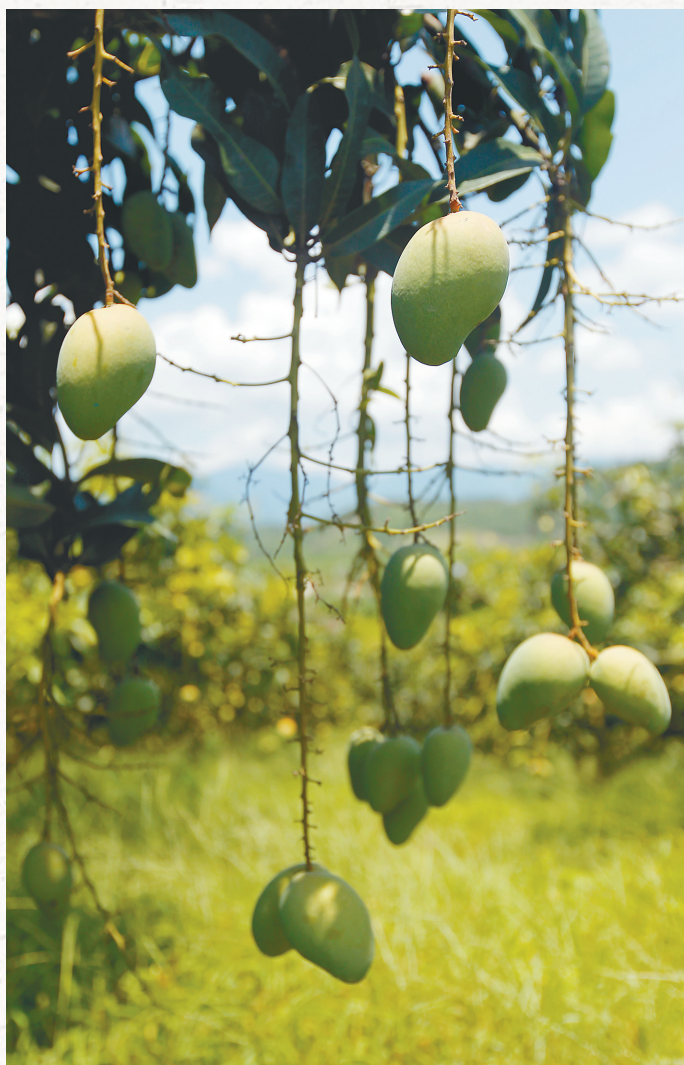
昌江黎族自治县七叉镇的芒果。苏晓杰 摄