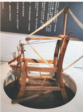
脚踏缫丝车。资料图

正因如此，此时的农业劳作不能有丝毫懈怠。我国民间有“小满动三车（丝车、油车、水车）”的说法，这说明小满时节是农事的一个关键期。