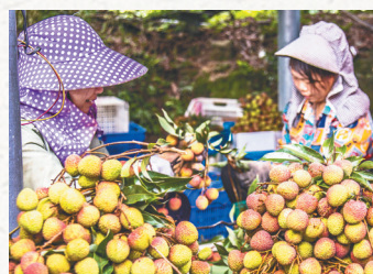
近日，儋州市多个镇的荔枝进入采摘季。