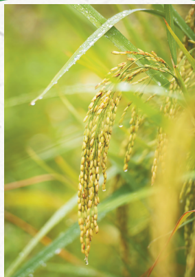
琼海市嘉积镇桥头村的水稻稻穗。