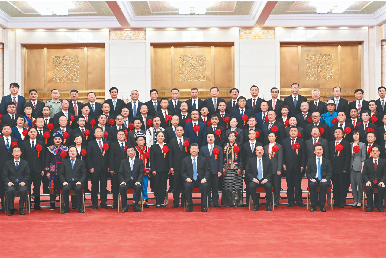
5月25日，党和国家领导人习近平、李克强、王沪宁、韩正等在北京人民大会堂会见第九次全国信访工作会议代表。

新华社北京5月26日电 第九次全国信访工作会议25日至26日在京召开。中共中央总书记、国家主席、中央军委主席习近平亲切会见会议代表，向受表彰的先进集体和先进个人表示热烈祝贺，向全国信访系统广大干部职工表示诚挚问候。 中共中央政治局常委李克强、王沪宁、韩正参加会见。 25日上午，习近平等来到人民大会堂北大厅，全场响起热烈掌声。习近平等走到代表们中间，同大家亲切交流并合影留念。