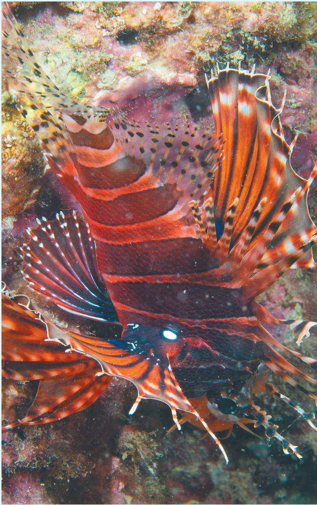
在分界洲岛海域，狮子鱼在海底游动（5月27日摄）。