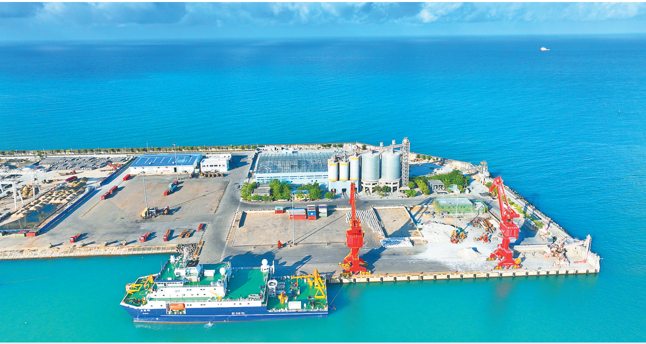
三亚南山港区建设 稳步推进

习近平强调，中华优秀传统文化是中华文明的智慧结晶和精华所在，是中华民族的根和魂，是我们在世界文化激荡中站稳脚跟的根基。我们坚持把马克思主义基本原理同中国具体实际相结合、同中华优秀传统文化相结合， 下转A02版 ▶