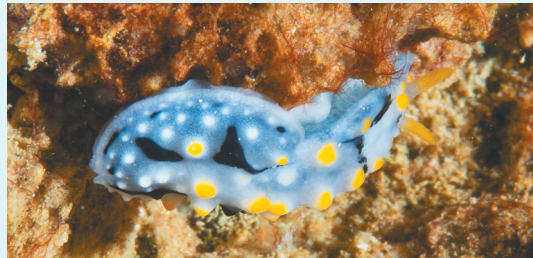
华美叶海牛在海底爬行（5月27日摄）。