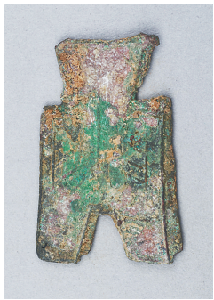
战国赵“蔺”平首方足布。

币，定安馆还藏有唐、宋、明、清及至民国时期的钱币，这里不再一一赘述。另外像市面上常见的外国钱如越南的景兴通宝、明命通宝，日本的宽永通宝等，定安馆也有收藏，这些钱币明显受到中国铸币的影响，从侧面可看出当时中外文化、贸易交流的频繁。