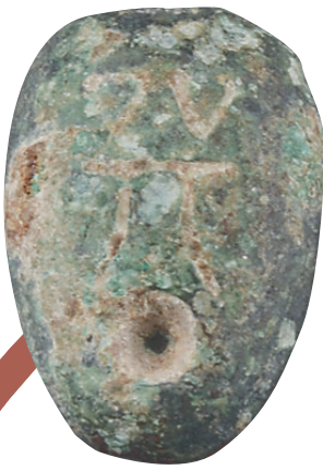
战国楚铜贝（鬼脸钱）。