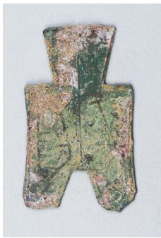
战国赵“平阳”平首方足布。