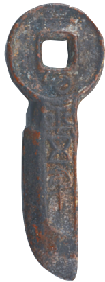
清至民国仿「一刀平五千」花钱。