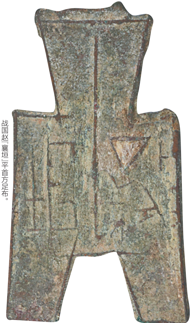
战国赵「襄垣」平首方足布。