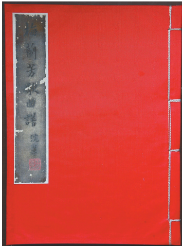
刘天华《梅兰芳歌曲谱》（1930年）。江阴市博物馆藏

刘天华是一个极具天才的音乐家。因为英年早逝，人们总愿意把他和奥地利才华横溢的天才音乐家莫扎特相提并论。他的音乐，融合了中西音乐最精髓的部分，以固有国粹为底子，借鉴、容纳西方音乐的精华。