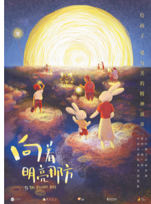
《向着明亮那方》海报