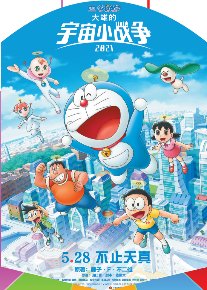
《哆啦A梦:大雄的宇宙小战争 2021》海报