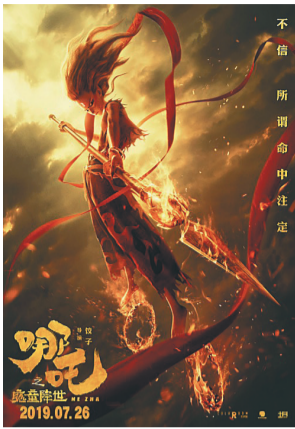
《哪吒之魔童降世》海报

本期海南周刊影视版为您推荐一份汇聚中外佳片的“六一”片单,除了部分影院新片外,还有许多经典老片,希望能让小朋友们在成长过程中充满快乐、勇气与希望,让大朋友们乘坐“时光机”重温童年旧时光。