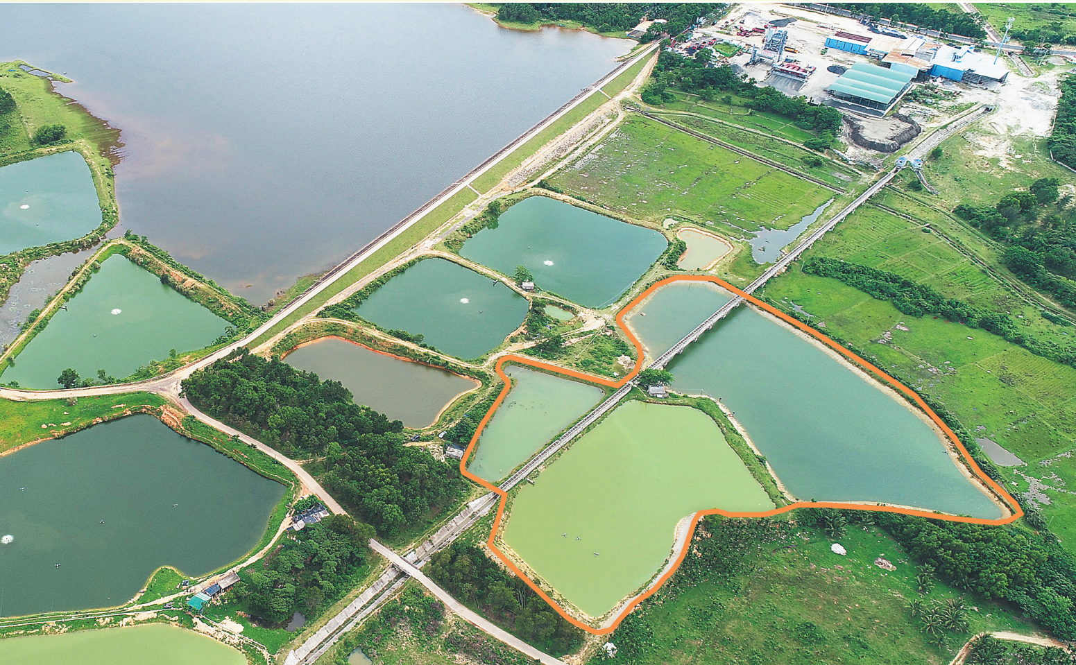
文昌市抱罗镇山梅村名园水库堤坝下3个鱼塘（图中橙线标注位置）侵占基本农田、保护林地，被取缔后又复养。