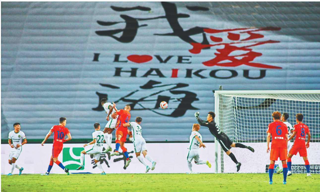
6月3日晚,2022赛季中国足球超级联赛在海口五源河体育场正式开幕。在海口赛区的首场比赛中,卫冕冠军山东泰山队以1比0战胜“升班马”浙江队。

2022赛季中超联赛共有18支球队参加,设海口、梅州和大连三个赛区。在海口赛区参赛的6支球队是山东泰山队、河南嵩山龙门队、浙江队、长春亚泰队、广州城队和大连人队。4日下午和晚上将进行首轮另外两场比赛,分别由长春亚泰队对阵广州城队、大连人队对阵河南嵩山龙门队。 (相关报道见A02版)