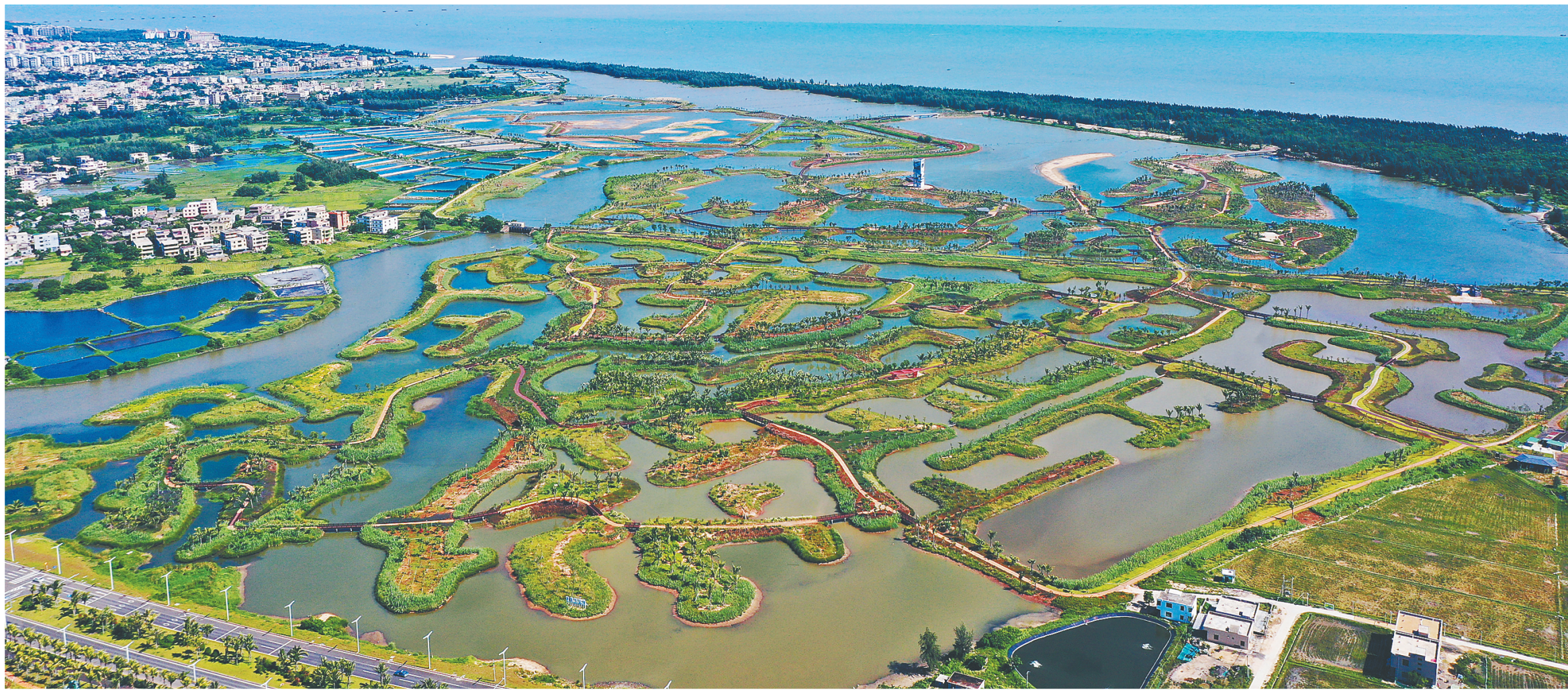
海口江东新区迈雅河湿地。