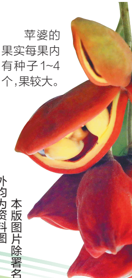
苹婆的果实每果内有种子1~4个，果较大。