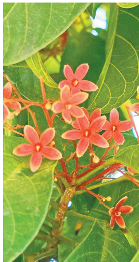
假苹婆花呈现淡淡的红色。

人们行路途中，轻盈地穿过这一片片绿洲，逃脱于繁忙、规则的都市节拍外，终于拥有了远离烦嚣的片刻闲适。