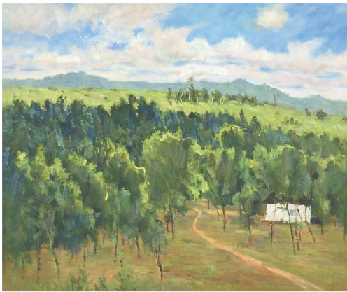
林国华《绿色家园》(油画)