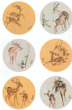
柯兴发《金鹿呈祥》(中国画)