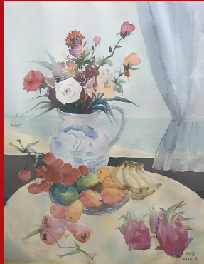
冯海《春华秋实》(水彩)