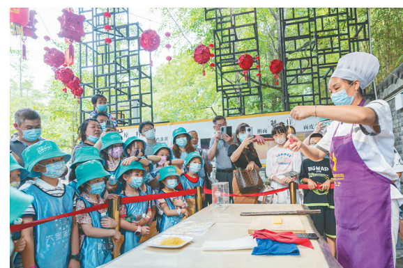
2021年,川菜烹饪技艺入选第五批国家级非物质文化遗产代表性项目名录。图为在川菜博物馆,厨师为游客演示川菜烹饪技法。