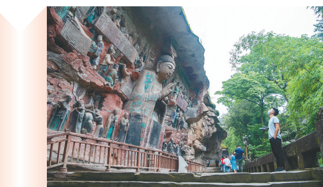
6月11日,大足石刻文物医院正式亮相。图为游客在重庆大足石刻景区参观。大足石刻是重庆市大足区境内所有石刻造像的总称,被列为世界文化遗产。 新华社发

6月11日,两名市民离开湖北武汉武昌区江滩黄花矶凉亭(无人机照片)。 近期,长江武汉段水位持续上涨,逼近武汉长江防汛25米设防水位。 新华社发