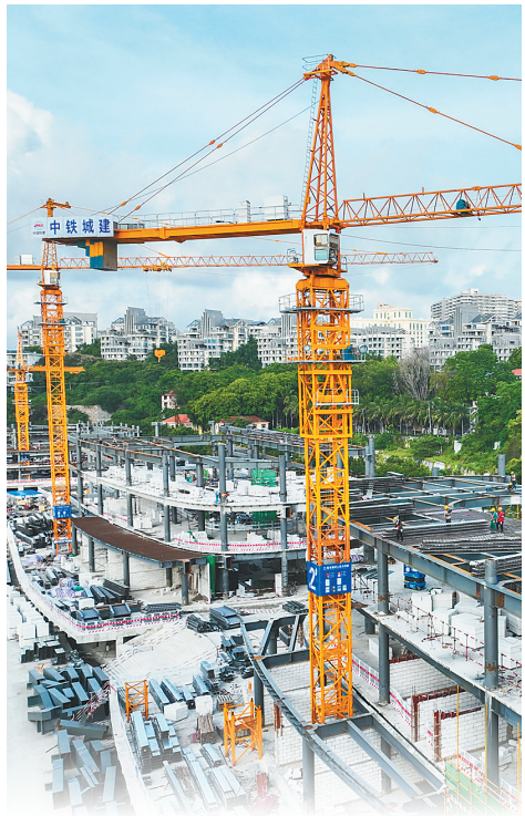
俯瞰三亚国际游艇中心项目。 在三亚国际游艇中心项目现场，工程人员施工忙。