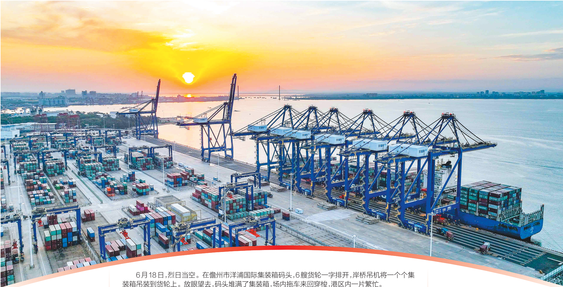
近日,一艘轮船停靠在洋浦国际集装箱码头。

6月18日,烈日当空。在儋州市洋浦国际集装箱码头,6艘货轮一字排开,岸桥吊机将一个个集装箱吊装到货轮上。放眼望去,码头堆满了集装箱,场内拖车来回穿梭,港区内一片繁忙。 单日吞吐量超7000个标箱,最高船时效率每小时达235自然箱,单机作业效率每小时达43自然箱……今年以来,洋浦国际集装箱码头不断地创造历史新高。 今年4月12日,习近平总书记在洋浦国际集装箱码头考察调研时强调,振兴港口、发展运输业,要把握好定位,增强适配性,坚持绿色发展、生态优先,推动港口发展同洋浦经济开发区、自由贸易港建设相得益彰、互促共进,更好服务建设西部陆海新通道、共建“一带一路”。