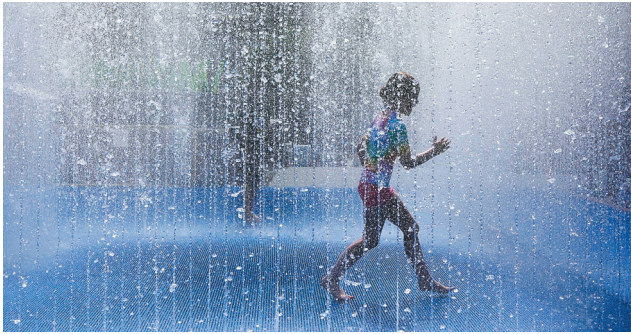
儿童在英国伦敦一处喷泉中玩耍。