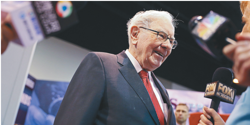
巴菲特出席会议资料照片。

一位匿名买家日前以1900万美元拍得与美国著名投资人沃伦·巴菲特共进午餐的机会,创下“巴菲特午餐”拍卖最高纪录。这是最后一次举办“巴菲特午餐”拍卖。