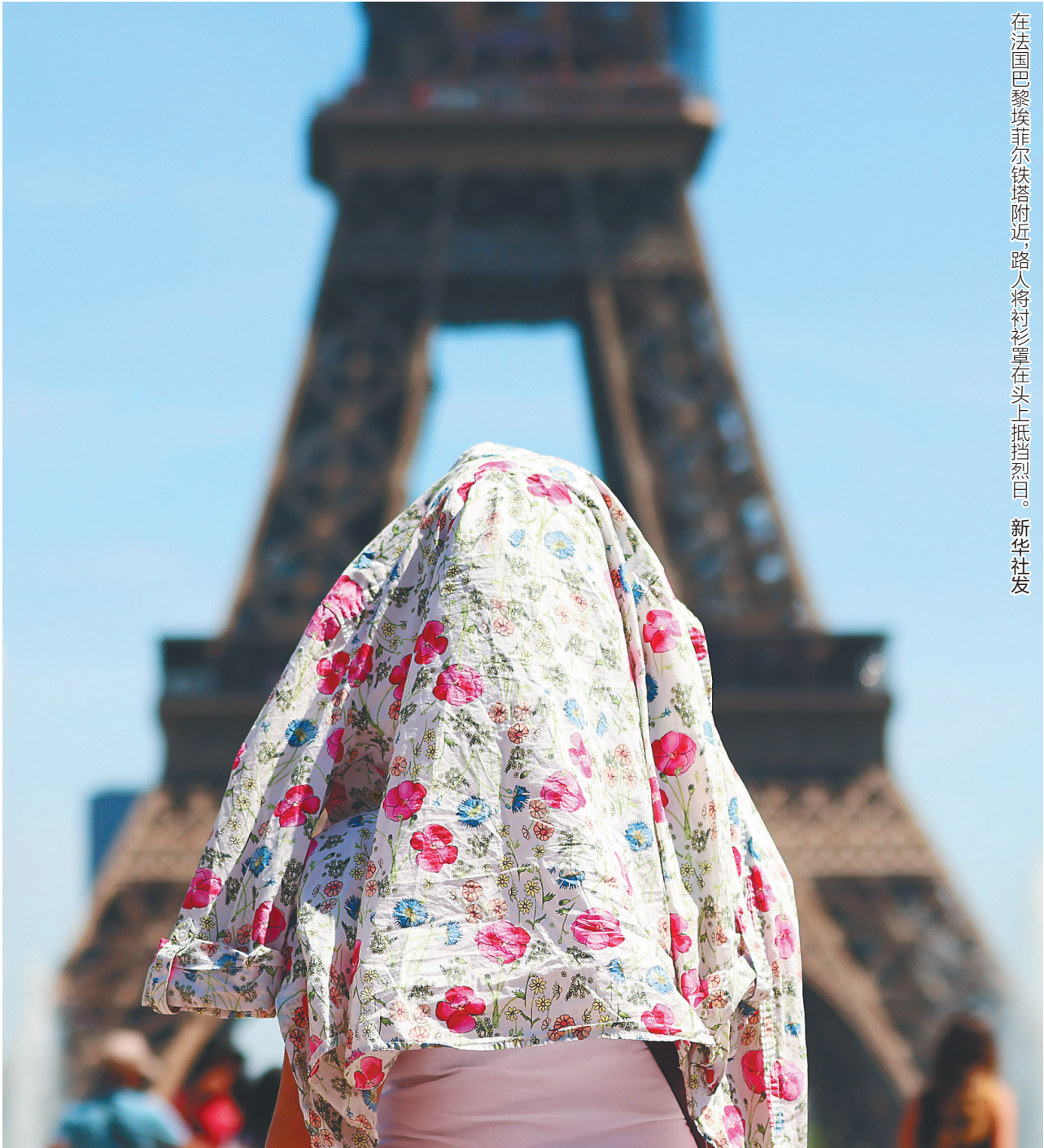
在法国巴黎埃菲尔铁塔附近,路人将衬衫罩在头上抵挡烈日。

意大利农民协会说,该国北部约一半农业区的降水量只有去年同期的一半左右,农作物受到干旱威胁,损失估计为10亿欧元。都灵所在的皮埃蒙特大区主席阿尔贝托·奇里奥说,意大利最长的河流波河今年的水量比正常年份低72%,而这条河对农业灌溉至关重要。皮埃蒙特部分区域已经连续110天没有降雨,而去年冬天的降雪量也很少,这使形势更加严峻。