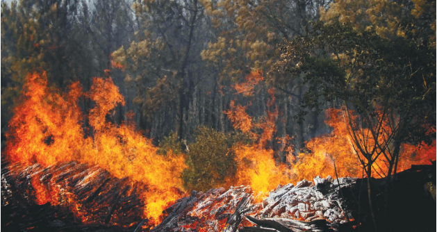
法国近日持续高温,多地发生山火灾害。图为6月18日在法国热尼耶拍摄的山火。