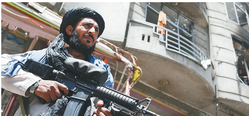
6月18日,塔利班武装人员在喀布尔寺庙袭击现场执勤。

阿富汗首都喀布尔一座锡克教寺庙18日遭到袭击,导致2人死亡、7人受伤。极端组织“伊斯兰国”认领这起袭击。