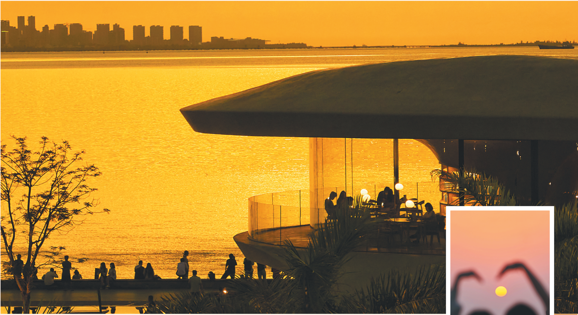
落日余晖映晚霞 一抹夕阳美如画

平台；做大做强临港产业园，重点培育壮大石化新材料、海洋装备制造、清洁能源等三大产业集群，打造国家级绿色低碳循环发展示范区。四是聚焦发展旅游业、现代服务业、高新技术产业和热带特色高效农业四大主导产业，全面提升经济质量效益和核心竞争力。五是打造西南部区域经济、交通物流、文化教育、医疗健康和旅游消费“五大中心”，高质量打造现代化西南部中心城市。六是全面建设富裕、品质、美丽、文明、幸福、清廉“六个新东方”，打造滨海城市典范，使东方成为滨海城市的节点城市和亮点城市。