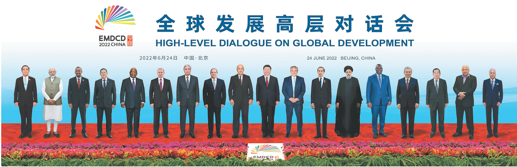
◀ 6月24日晚，国家主席习近平在北京以视频方式主持全球发展高层对话会并发表题为《构建高质量伙伴关系 共创全球发展新时代》的重要讲话。