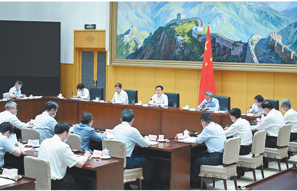
6月24日，中共中央政治局常委、国务院副总理、推进海南全面深化改革开放领导小组组长韩正在北京主持召开推进海南全面深化改革开放领导小组专题会议，认真学习贯彻习近平总书记关于海南自由贸易港建设的重要讲话精神，审议有关政策文件，研究部署下一步重点工作。