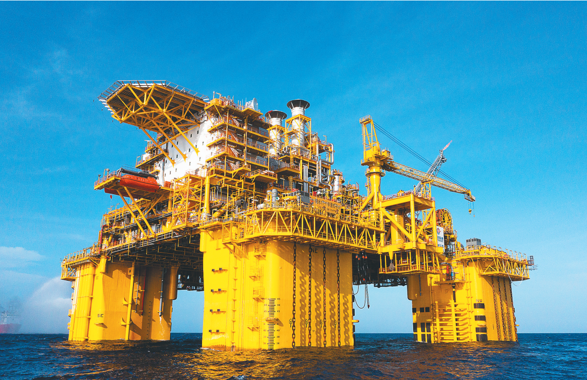
“深海一号”大气田的核心:“深海一号”能源站。

现了从300米向1500米超深水的历史性跨越。 据了解,“深海一号”大气田采取“半潜式生产平台+水下生产装置+海底管线”的全海式生产模式开发,首创世界独一无二的“保温瓶内胆式”立柱储油技术,能实现采出油气的就地分离和凝析油的安全存储, 下转A02版▶