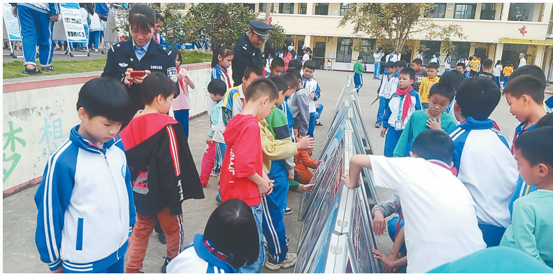
琼中长征学校的学生在阅读宣传栏上的禁毒知识。

结合该县禁毒工作实际,琼中禁毒委各成员单位始终将社区戒毒(康复)执行、社会面吸毒人员风险评估