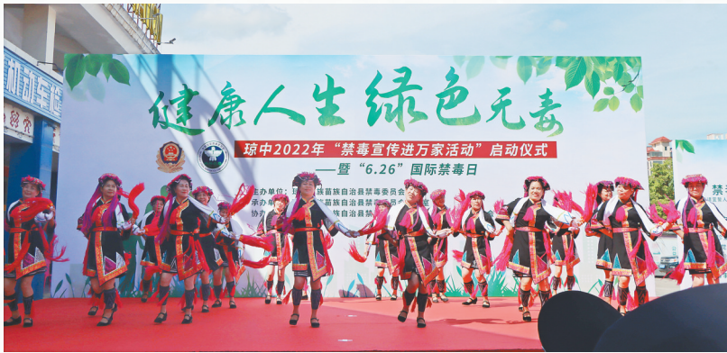
6月22日,琼中举行“6·26”国际禁毒日暨“禁毒宣传进万家”活动。

琼中黎族苗族自治县禁毒工作严格按照该县县委县政府和省禁毒委的决策部署要求,持续深入开展新一轮禁毒三年大会战,以实施“清源断流”、整治突出毒品问题为目标,构建全民禁毒工作格局,统筹各方资源,动员社会力量,多措并举,实现了吸毒人员与常住人口占比从2021年的0.6‰下降到0.41‰,禁毒工作成效明显。