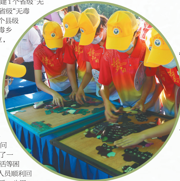
学生体验禁毒趣味拼图游戏。

4370余人次,社戒社康人员享受低待遇75人,共发放低保金76375元,发放慰问品慰问金6.68万元,解决了一批吸毒人员就业生活等困难问题,打通吸毒人员顺利回归社会正常生活最后一公里。