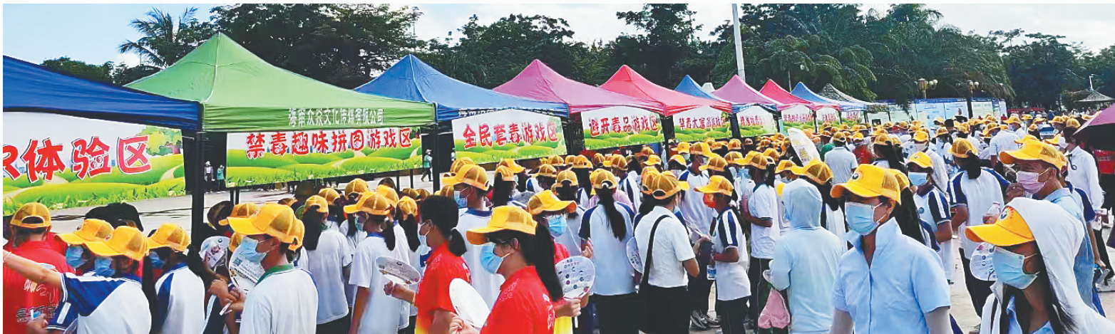
日前,陵水开展禁毒宣传活动。 本组图片均由陵水公安局提供