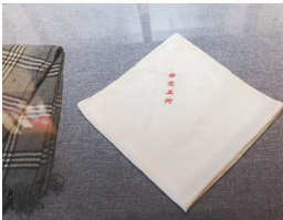
陈德华留下的手帕，上面绣着“毋忘五卅”4个字。

竹林掩映，曲径通幽，走进位于海口市解放西路的中共琼崖一大旧址，思绪总是很容易被拉回到很久以前。这里是中共琼崖地方组织的诞生地，也是琼崖武装革命斗争二十三年红旗不倒的策源地。