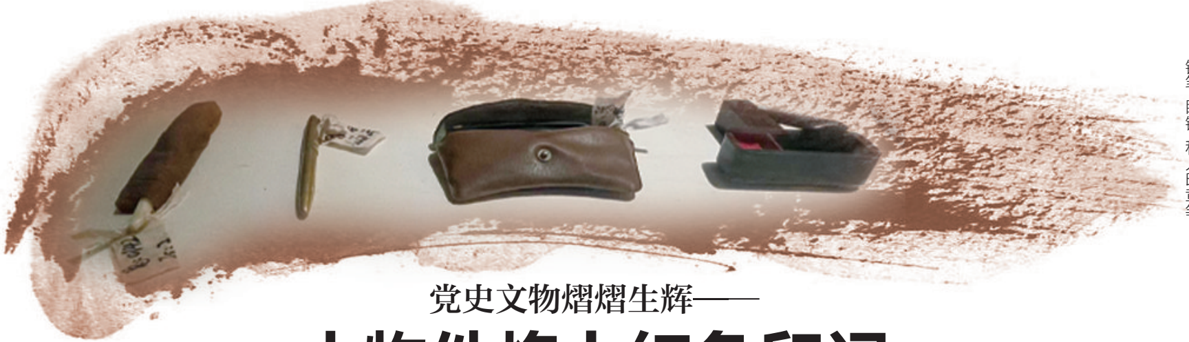
冯白驹使用过的牙刷、钢笔、眼镜、私人印章等。