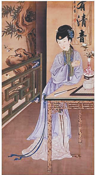
圆明园深柳读书堂十二扇美人画屏图（局部）。