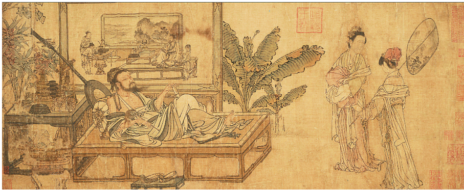
元代刘贯道《消暑图》。本版图片均为资料图