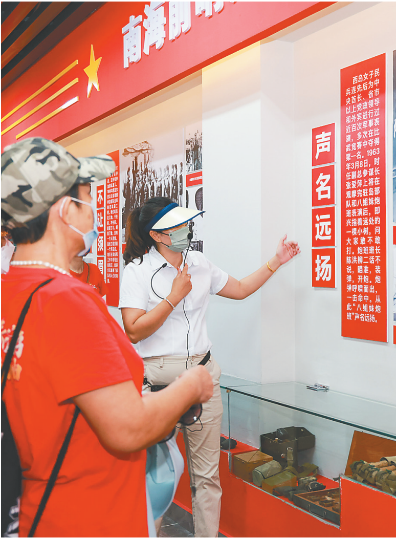
近日，三亚各单位优秀党务工作者、优秀党员代表在西岛女子民兵连纪念馆参观。