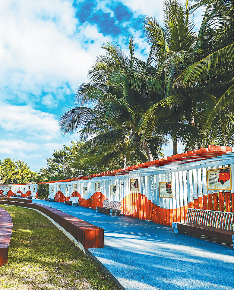
位于三亚河与临春河交汇地带的三亚市丰兴隆党群主题公园风景秀丽。该公园是集党建宣传、便民服务、人才交流、生态科普于一体的综合服务平台。