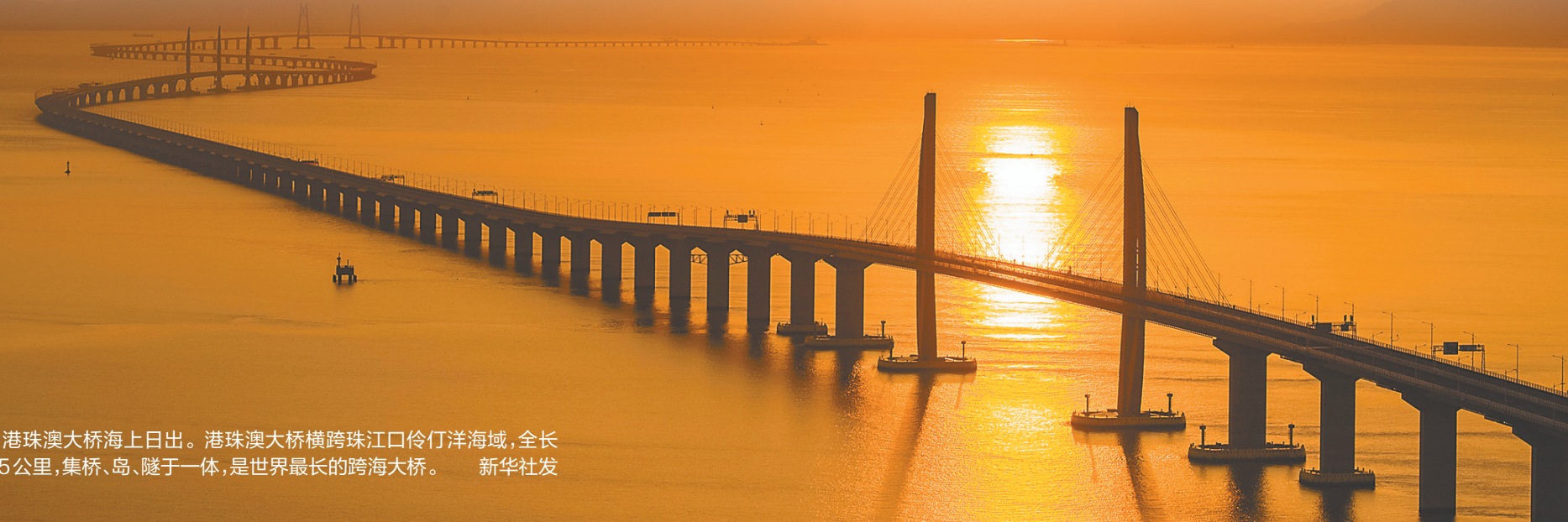
港珠澳大桥海上日出。港珠澳大桥横跨珠江口伶仃洋海域，全长约55公里，集桥、岛、隧于一体，是世界最长的跨海大桥。