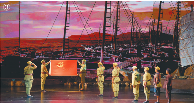
7月1日晚,舞台剧《临高号角·抢滩》在省歌舞剧院上演,再现人民解放军抢滩临高角,以艺术方式诠释“抢滩精神”。图①②③均为剧照。