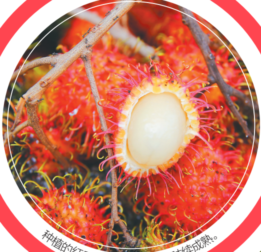
种植的红毛丹“保研-7号”已陆续成熟。

要做强做优热带 特色高效农业,积极引 进热带果蔬优质品种, 做足“季节差、名特优、绿 色有机”文章。 ——摘自省第八次 党代会报告