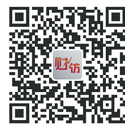
扫码查看合格境外有限合伙企业试点政策图解。