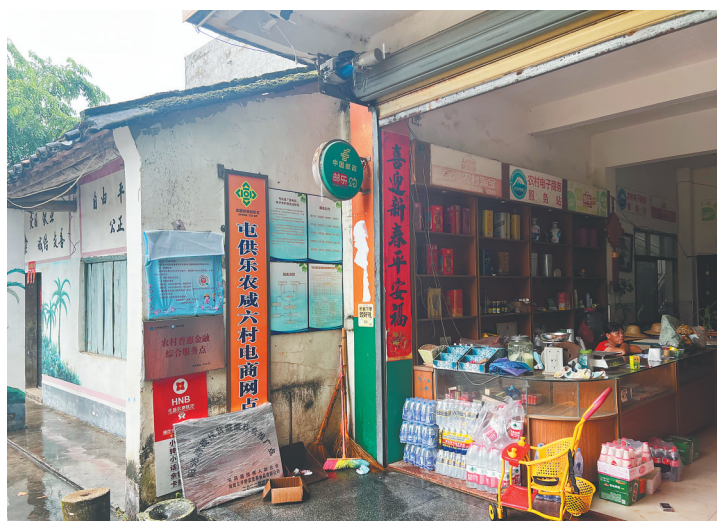
屯昌南吕镇咸六村电子商务服务站“名存实亡”。