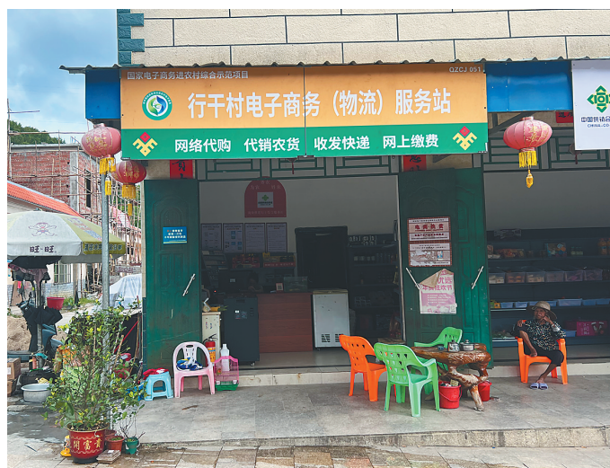
琼中黎族苗族自治县上安乡行干村的一间电商服务站未开通快递、网上卖货等业务。

但记者近日在琼中、白沙、屯昌等多市县走访发现,部分市县村、镇电商服务站(电商服务中心)存在功能不全、服务缺失等问题,有的甚至已停止运营,农产品上行的“最初一公里”和网购商品下行的“最后一公里”在此阻滞。