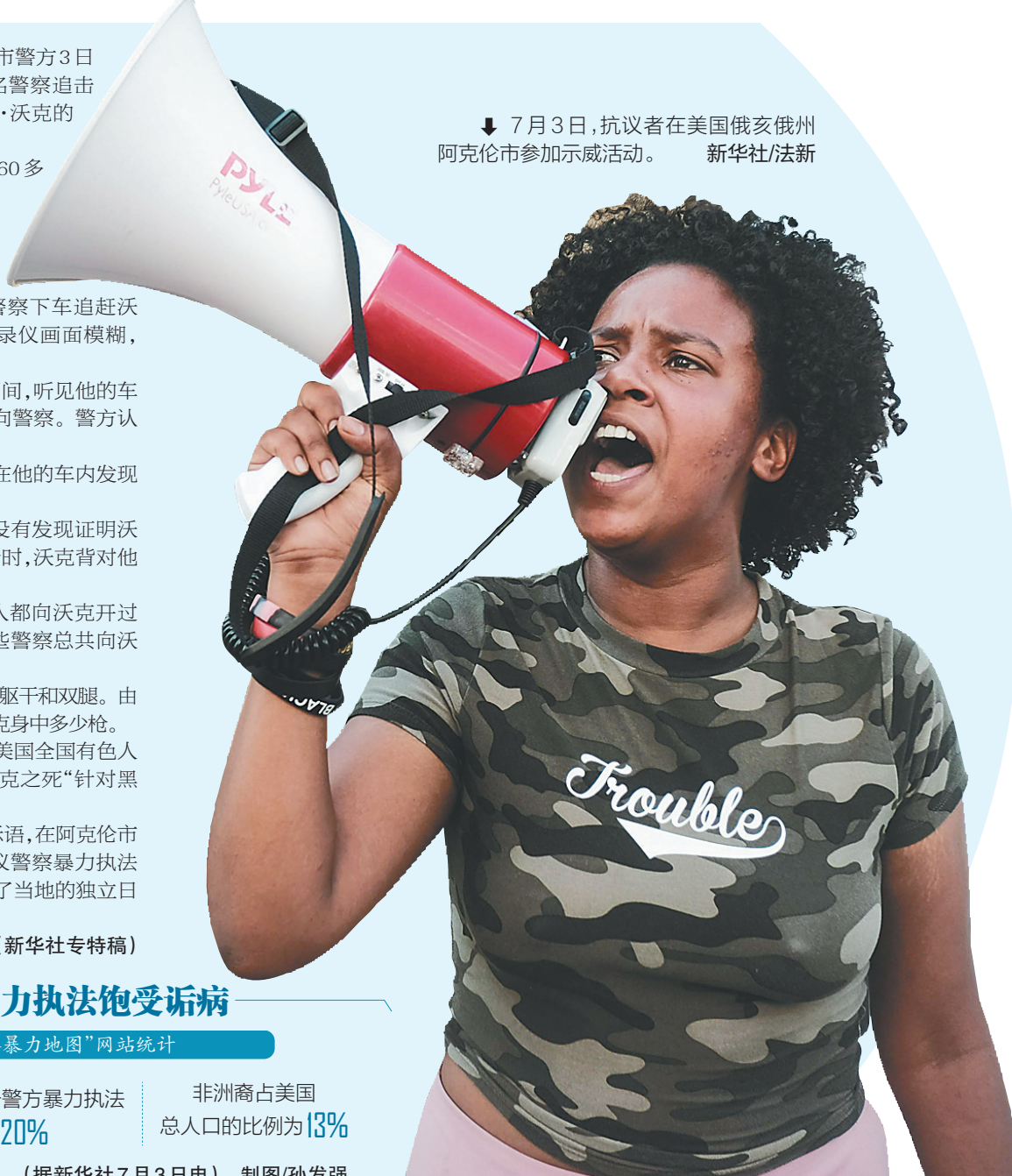
7月3日,抗议者在美国俄亥俄州阿克伦市参加示威活动。