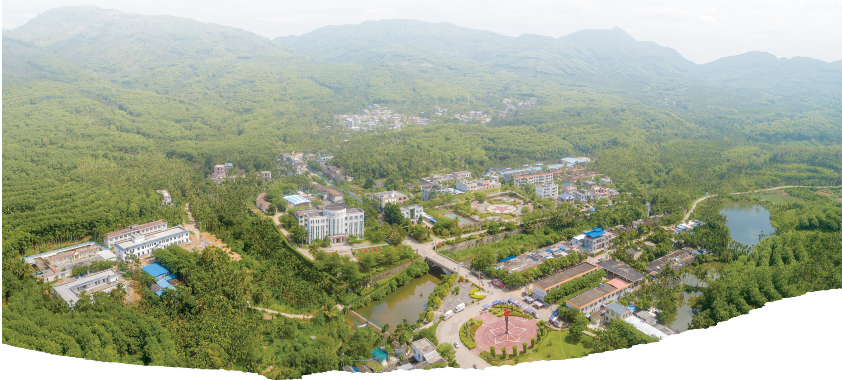
定安母瑞山。

蒙汉强是琼崖妇女解放运动的先驱,更是少见的女性指战员。她积极发动广大妇女参加革命斗争,和红色娘子军并肩战斗,为保障内洞山会议的顺利召开作出了突出贡献。在生命的最后时刻,她虽然身陷囹圄、饱受酷刑,仍能坚贞不屈、视死如归。