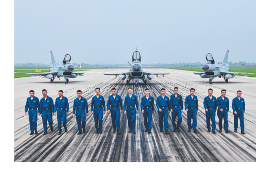
空军首批歼-10飞行员在石家庄飞行学院某旅机场合影(2022年7月15日摄)。

空军首批院校直接培养的三代机飞行员日前结业,这批平均年龄23岁的蓝天骄子即将奔赴一线作战部队。这标志着空军全新飞行人才培养体系正式构建、“多快好省”培养飞行员新路畅通。