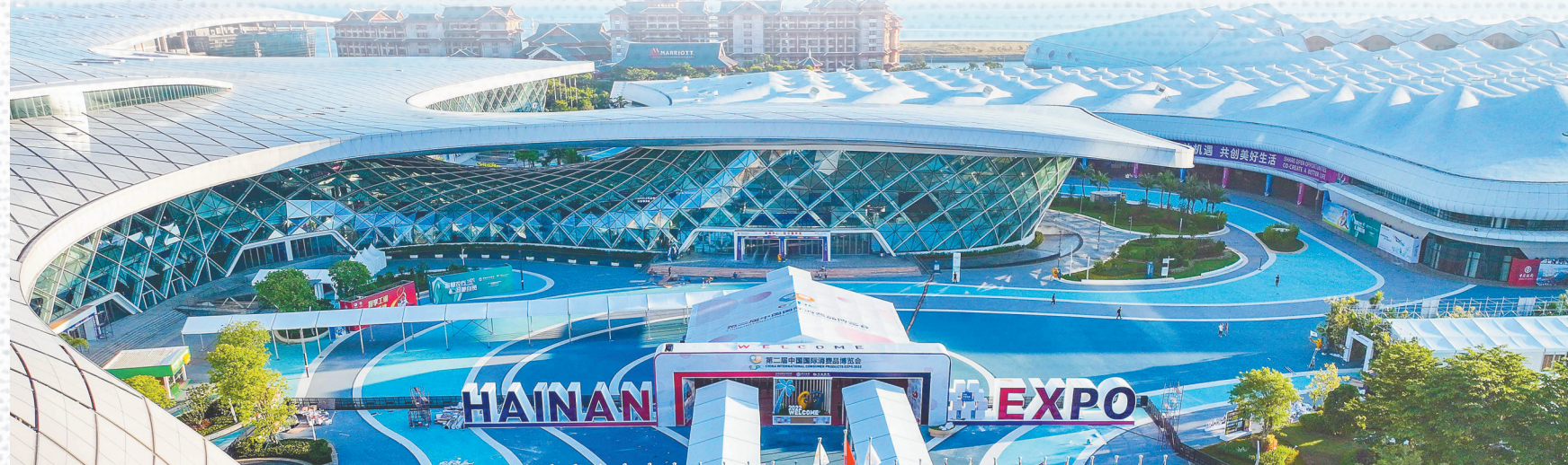
7月23日，第二届消博会主场馆海南国际会展中心以“新姿”静待八方来客。

“消博会时间”即将开启！ 作为全国唯一的以消费精品为主题的国家级展会，也是亚太地区规模最大的消费精品展，7月25日至30日在海口举办的第二届中国国际消费品博览会将让盛夏中的海南“热上加热”。 新亮点、新看点、新重点，相较于首届消博会，第二届消博会又多了不少“新意”。