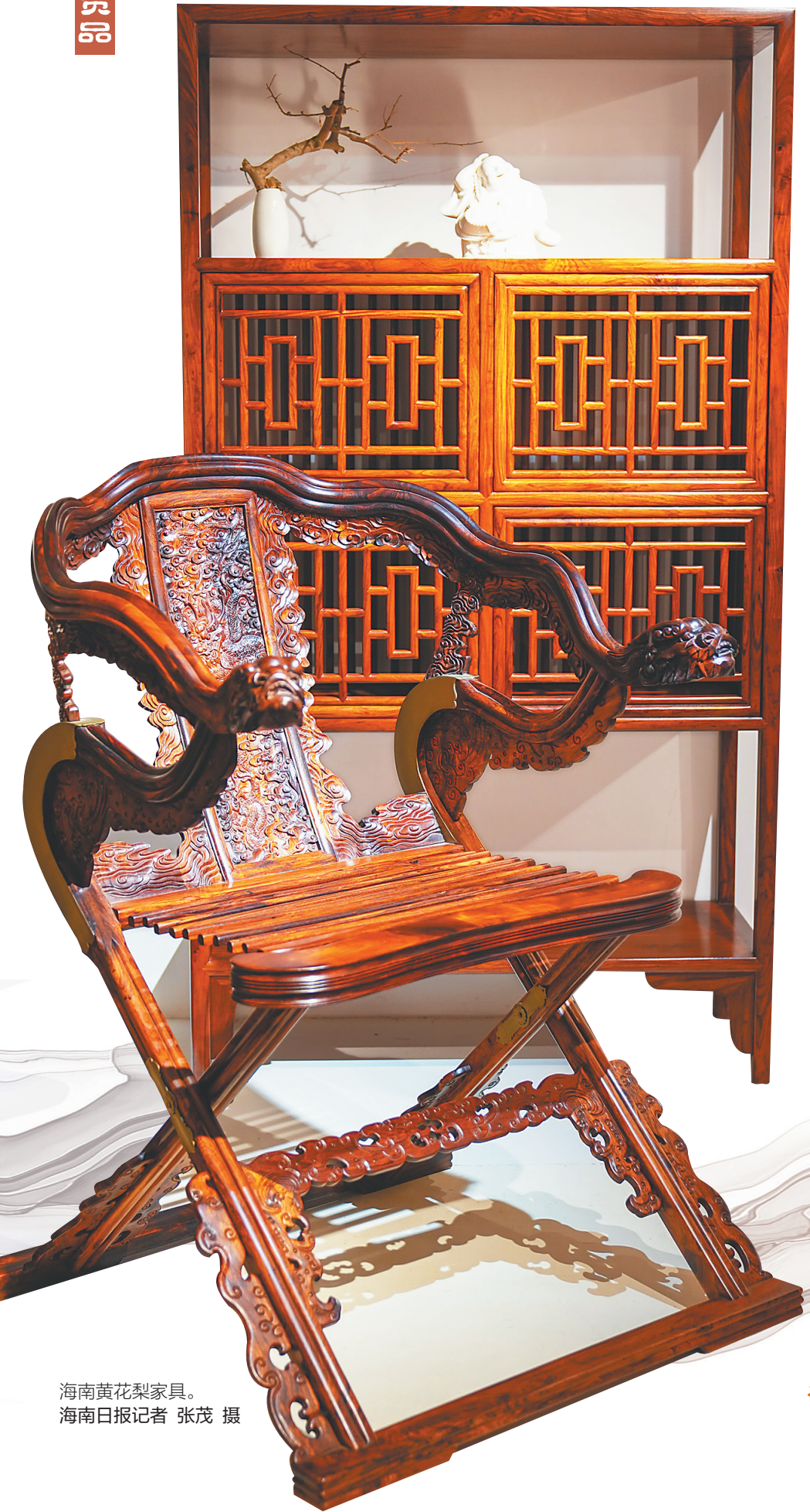
海南黄花梨家具。

海南自古以来物产丰富,多奇珍异宝,享有“南溟奇甸”之美誉。本期海南周刊封面聚焦南溟珍物,带您了解历史上的海南好物,敬请关注!