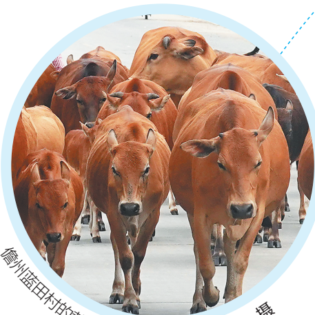
儋州蓝田村的黄牛。