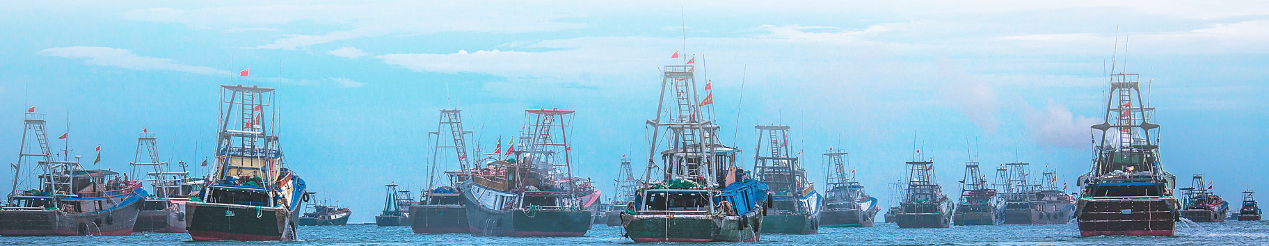
临高新盈镇头咀港，各类船舶有序出海。